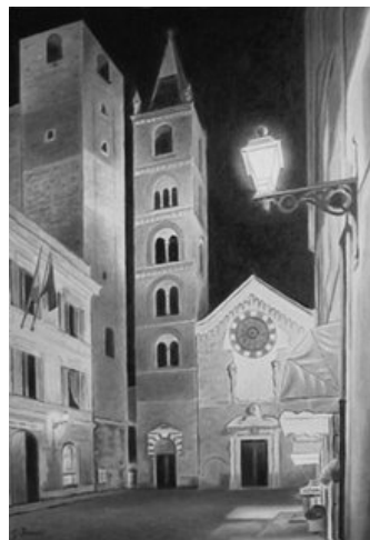
Piazza San Michele