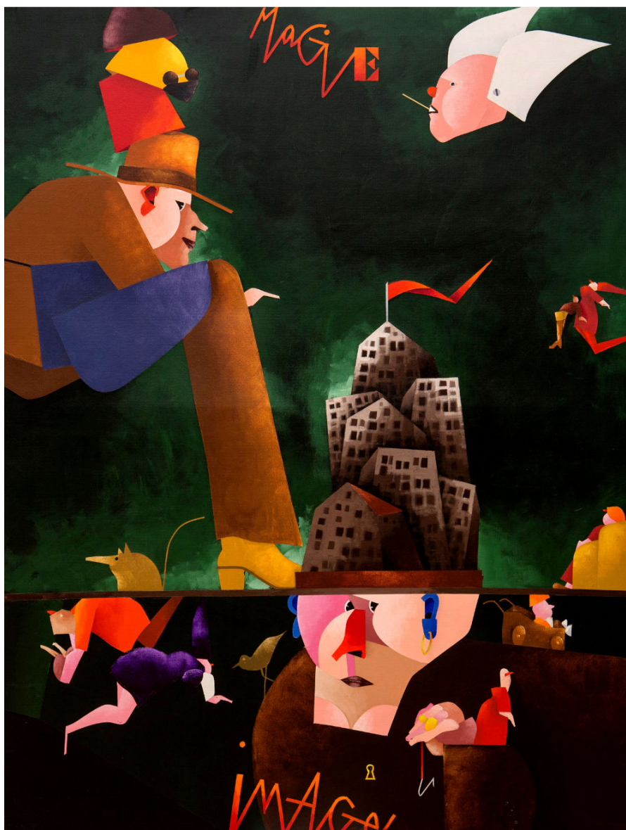
" FIABA " Emilio Tadini

Sez. E - Vernacolo "Memorial Antonio Regondi"