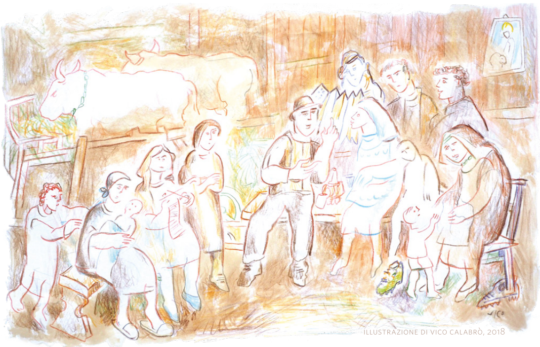
ILLUSTRAZIONE DI VICO CALABRÒ, 2018

CONCORSO LETTERARIO E FOTOGRAFICO 2018 IX EDIZIONE